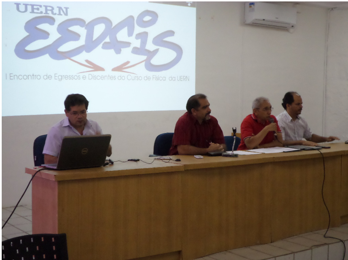
Abertura do I EEDFIS