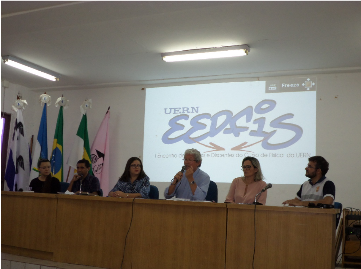
Mesa redonda com egressos e alunos do curso