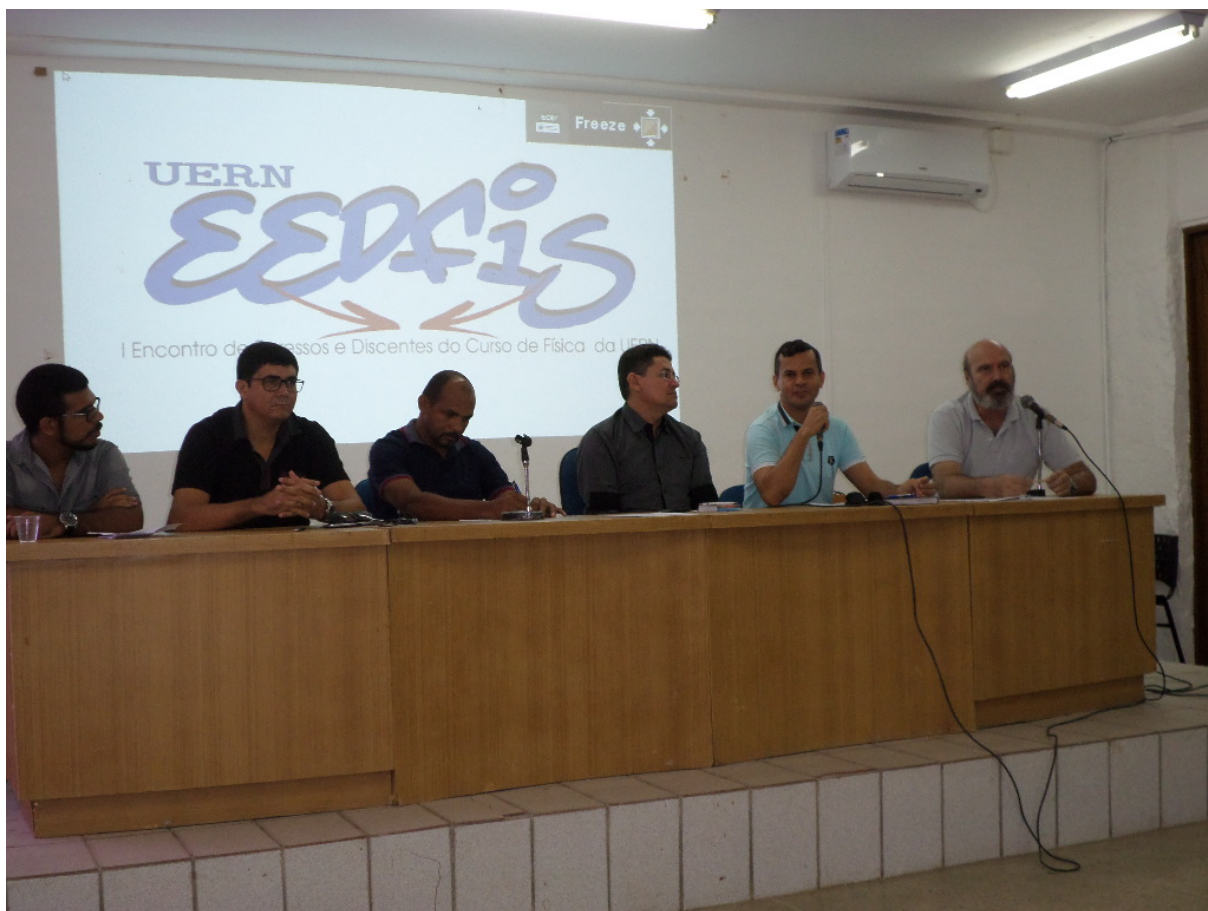
Mesa redonda: vivências significativas dos egressos nas escolas do Ensino Médio