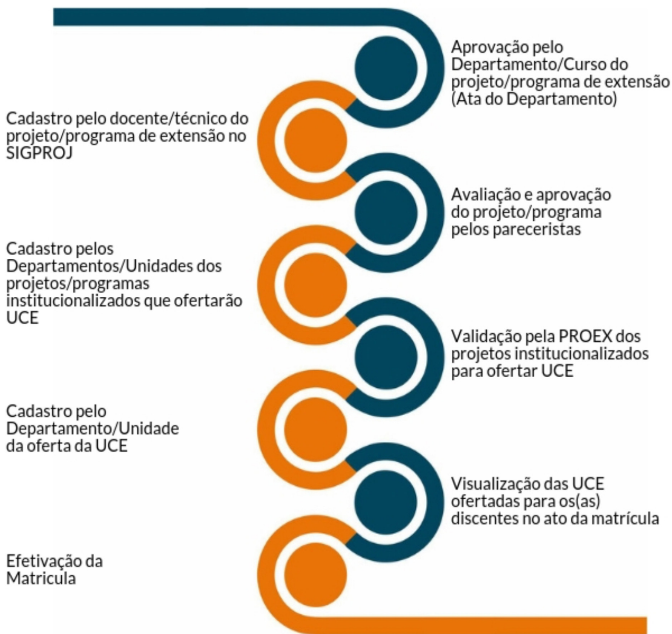
Figura 3 – Fluxo para oferta da UCE

que o mesmo matricule-se em uma UCE e só depois do início das atividades ele possa observar que as atividades necessárias ao cumprimento da UCE são incompatíveis com seu horário.